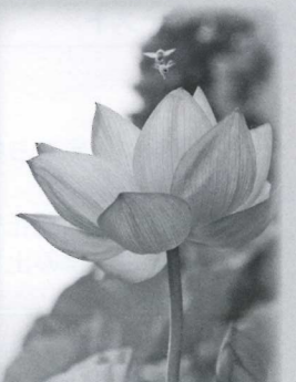
蓮の花は午前中が特にきれいです! 午後になると少しずつ花を閉じていきますのでお早めにご来場ください。